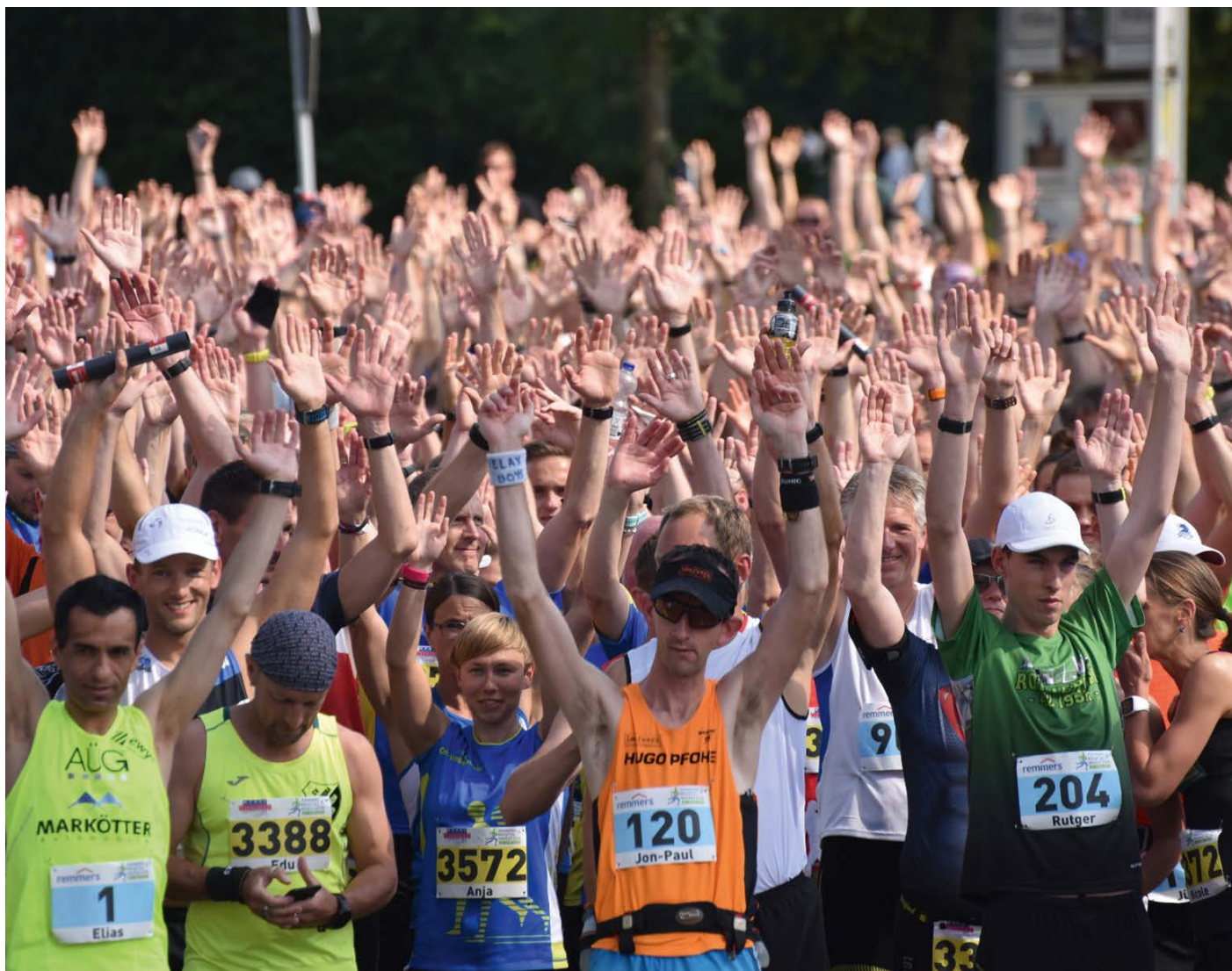
LÄUFERFEST Im Jahr 2019 nahmen erstmals mehr als 3.000 Läufern am Remmers-Hasetal-Marathon teil.

denken. Also allein durch den Wald, zu zweit um den See? Möglich war das, aber der Spaß hielt sich in Grenzen. Was tun? Füße hochlegen?