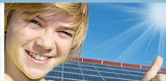
Für die Umwelt

Ihr Expertenteam für den Landkreis Cloppenburg und Umgebung. Jetzt Termin vereinbaren: 0152 31 97 41 86