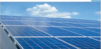
Für Gewerbe & Landwirtschaft