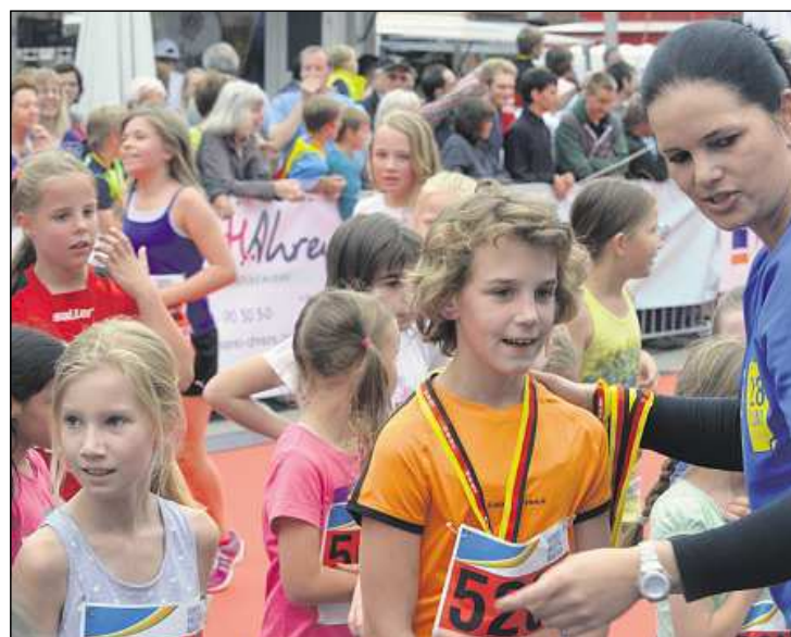
Betreuung im Ziel: Ein starkes Team der Sportlehrer der Gelbrink-Grundschule und Helfer zeichneten für die Organisation verantwortlich.