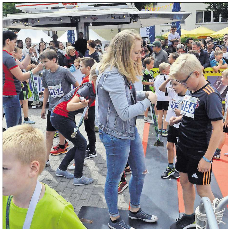
Prompter Lohn: Im Zielbereich empfingen die Lehrerinnen der Löninger Grundschule die Mädchen und Jungen und zeichneten sie gleich mit der bronzenen Teilnehmermedaille aus.

phie gehört ebenfalls zu den besten Läuferinnen Niedersachsens.