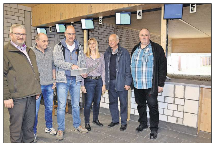
Das Fest kann kommen: Der Bauausschuss bespricht die abschließenden Arbeiten auf dem Kleinkaliberstand.