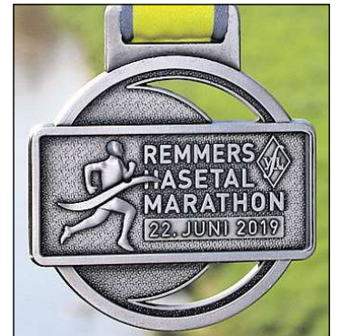
Finisher: Diese Medaille erhält jeder Teilnehmer.

sowie kostenlose Benutzung des beheizten Lönninger Wellenfreibades, ein stimmungsvolles Rahmenprogramm, mit mehreren Samba- und Musik-Gruppen sowie insbesondere mit der „Marathon-Night“-Party mit Liveband unmittelbar nach den sportlichen Wettbewerben openair im Zielbereich.