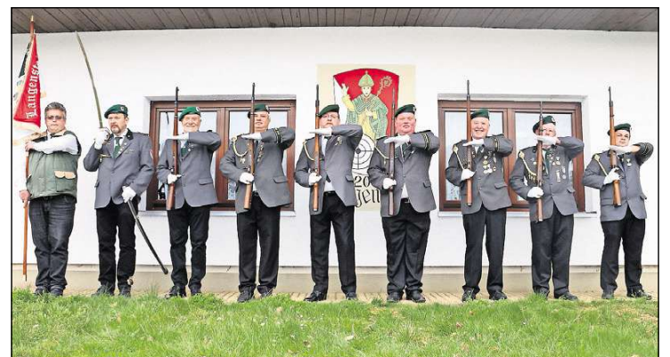
Ehrengäste: die Langensteiner Klippenschützen aus dem Harz.