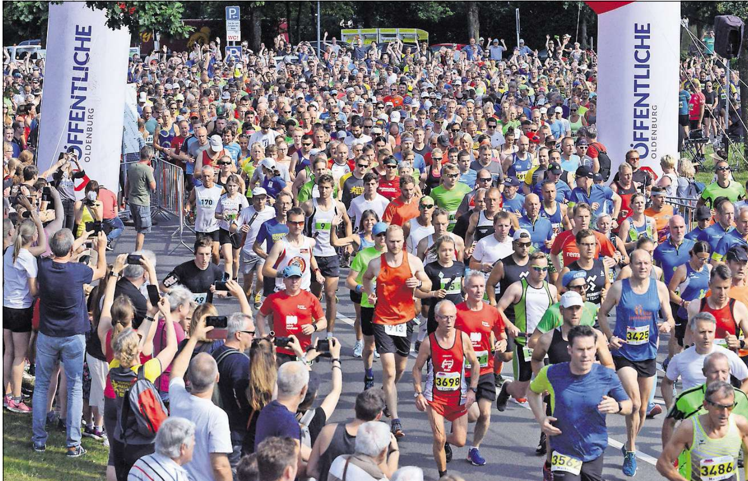
Kein Massenstart: Solche Bilder – wie hier vor zwei Jahren beim Beginn des Hauptlaufs – wird es im Juni 2021 beim Lönninger Hasetal-Marathon coronabedingt nicht geben.